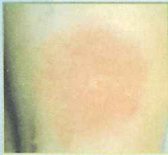
Exemple d'un érythème migrant sur une jambe